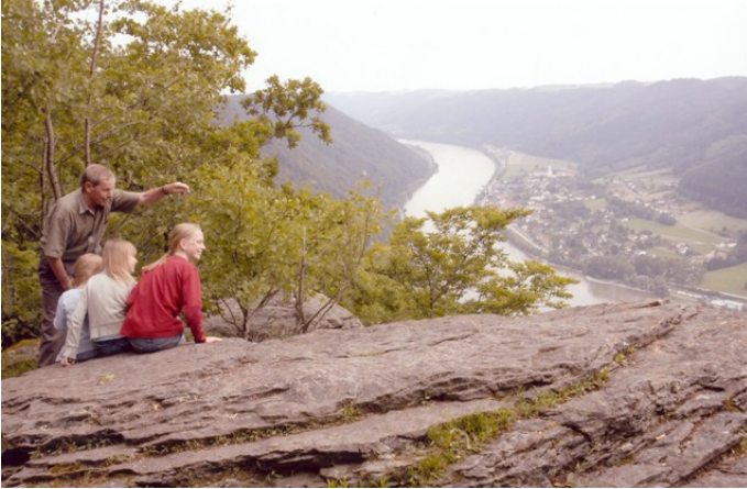
Blick vom Ebensteinfelsen